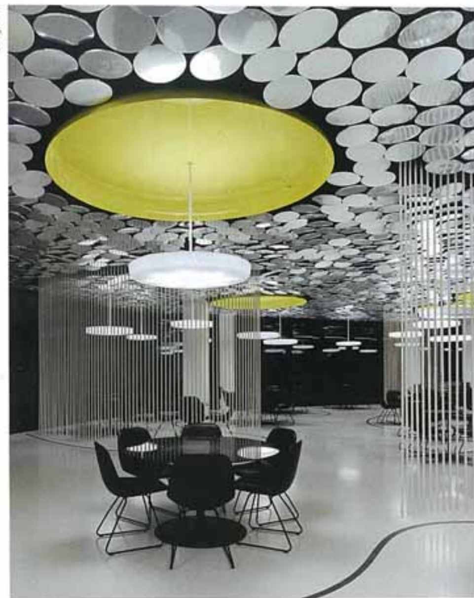
Kantine Der Spiegel, Hamburg, 2011, Interior Design: Ippolito Fleitz Group Der Spiegel canteen, Hamburg, 2011, interior design: Ippolito Fleitz Group

Even beyond such luxury projects, an integrated penetration of design aspects is characteristic for current interior concepts of bars and restaurants: Not only the interior furnishing and sometimes the architecture but also the lighting, decoration or branding corporate design are integrated into the design. The aesthetic guiding principle varies through to themes of sub-culture. The interior design of the recently opened Meatliquor Restaurant in London's West End, for example, plays with codes from an originally subcultural context. Tattoo or graffiti motifs are concentrated in the venue planned by Shed Design Studio to form a gloomy-glamorous decor.