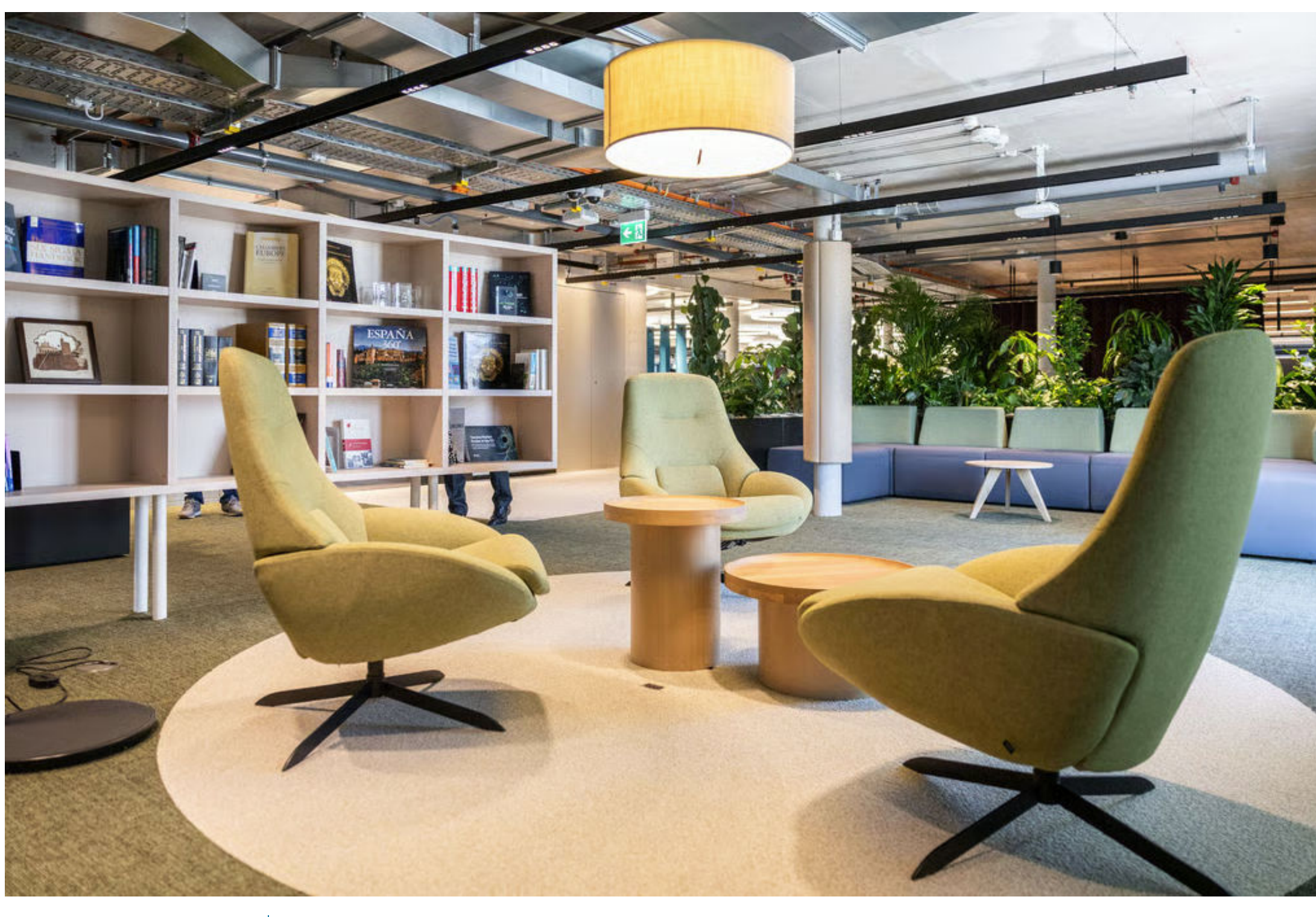
Die Bibliothek im Attikageschoss ist auch ein Arbeitsplatz.

Besonders beliebt dürfte das Attikageschoss sein. «Das Beste kommt zum Schluss» gilt für diesen Rundgang ebenfalls. Zwar gibt es hier oben offiziell keine Arbeitsplätze und dennoch wimmelt es von Möglichkeiten, sich mit dem Laptop irgendwo niederzulassen - zum Beispiel in der Bibliothek.