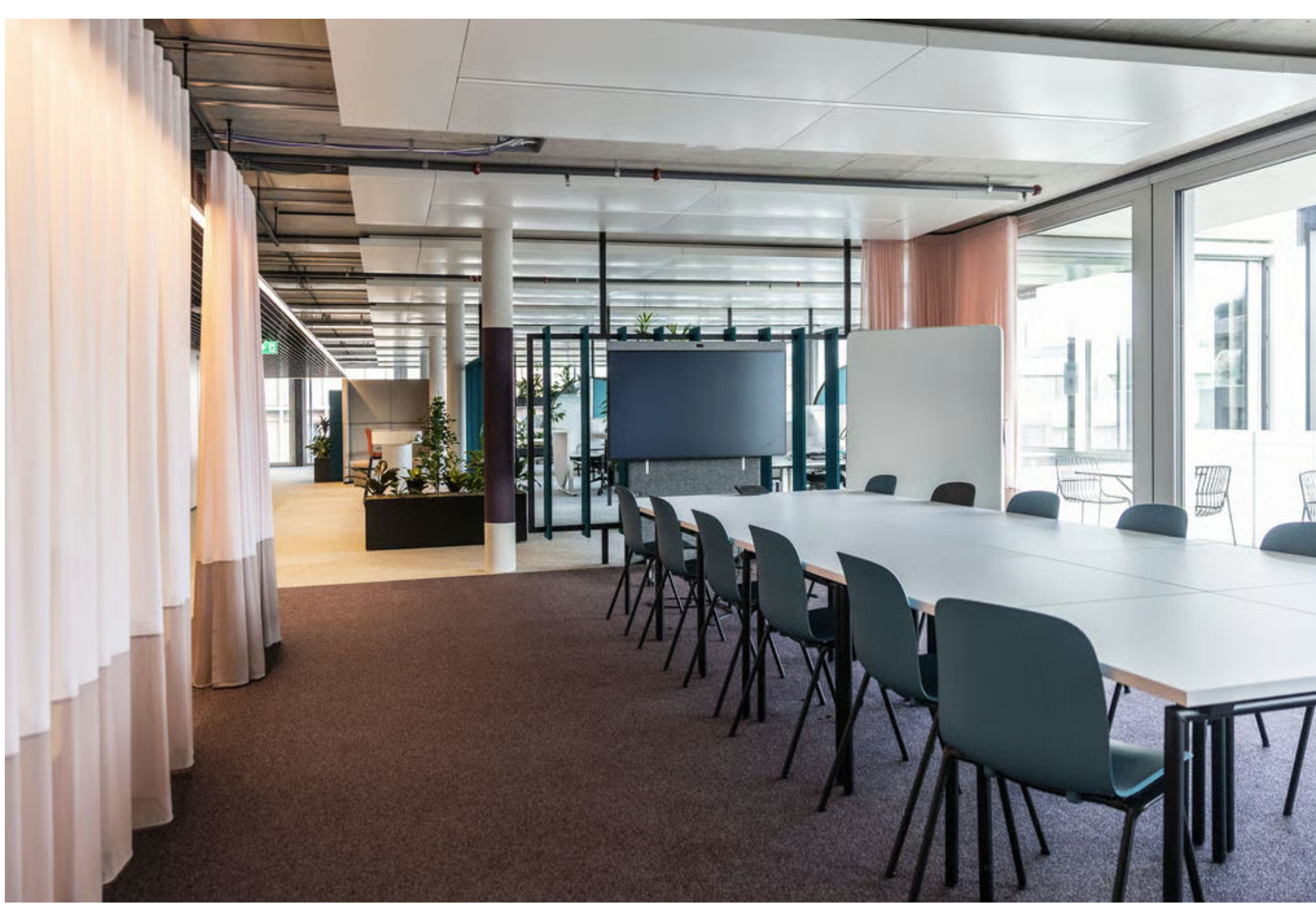
Ein Meetingraum - immer wieder sorgen, so wie hier, Vorhänge für die Raumteilung.