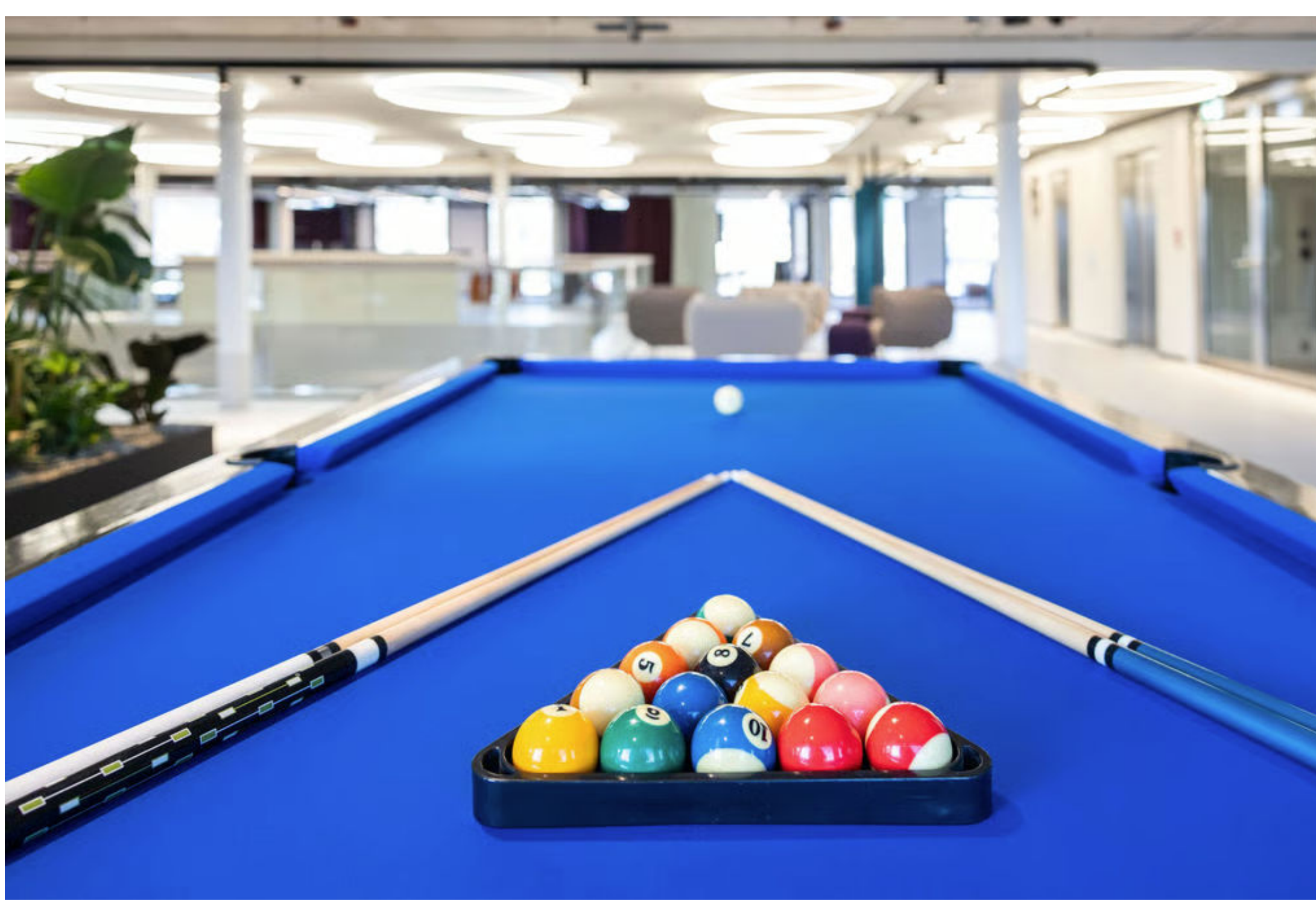
Billard und andere Spielmöglichkeiten sind im Attikageschoss zu finden.

In erster Linie ist die sechste Etage jedoch für Auszeiten gedacht. Das Angebot ist dank den vielen Arbeitsplätzen unter einem Dach weitaus grösser als an den bisherigen MSD-Standorten. Zur Auswahl stehen etwa Tischtennis, Billard, Töggelikästen, Playstation-Lounge, Fitnesscenter, Daybeds für Powernaps und eine Sonnenterrasse. Für Mütter ist sogar ein Stillzimmer mit Kühlschrank und Dusche/WC vorhanden.