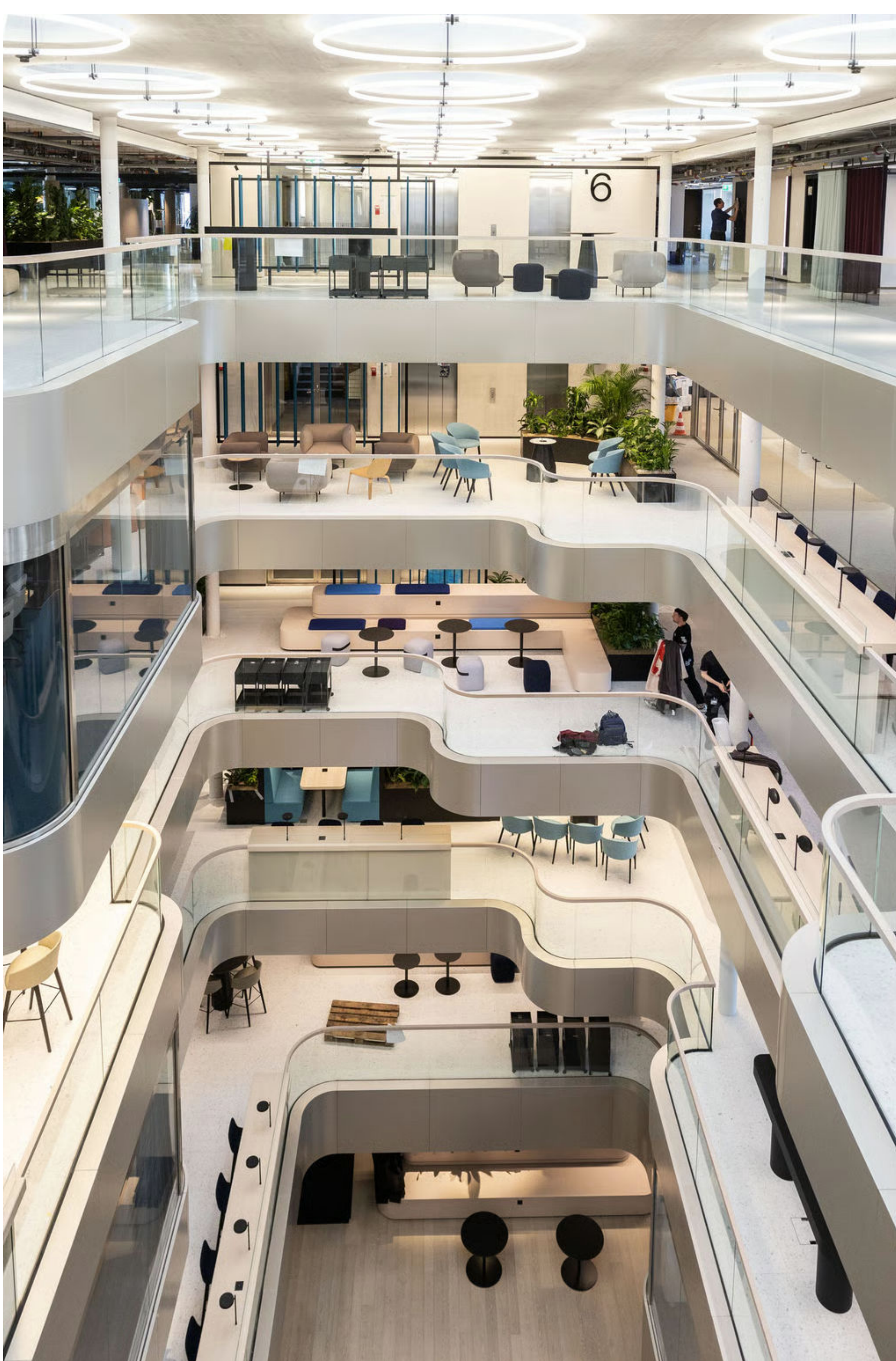
Nochmals das Atrium, diesmal aus dem Attikageschoss fotografiert.

Wir starten in der ersten Etage und marschieren gleich zur Agora im imposanten Atrium, das bis zur sechsten Etage reicht und von einem Dach mit runden Oblichtern gedeckt ist. Die Agora - im antiken Griechenland war damit der Markt- und Versammlungsort gemeint - mit ihren Sitzgelegenheiten und dem grossen Screen heisst MSD-intern auch Townhall. Denn hier beruft die Unternehmensleitung Meetings ein. Jede(r) kann sich dazu gesellen. Lichtbänder, die sich je nach Stimmung und Thema illuminieren lassen, sowie umlaufende Geschossbänder aus Aluminium erzeugen eine Atmosphäre, die entfernt an ein Raumschiff erinnert.