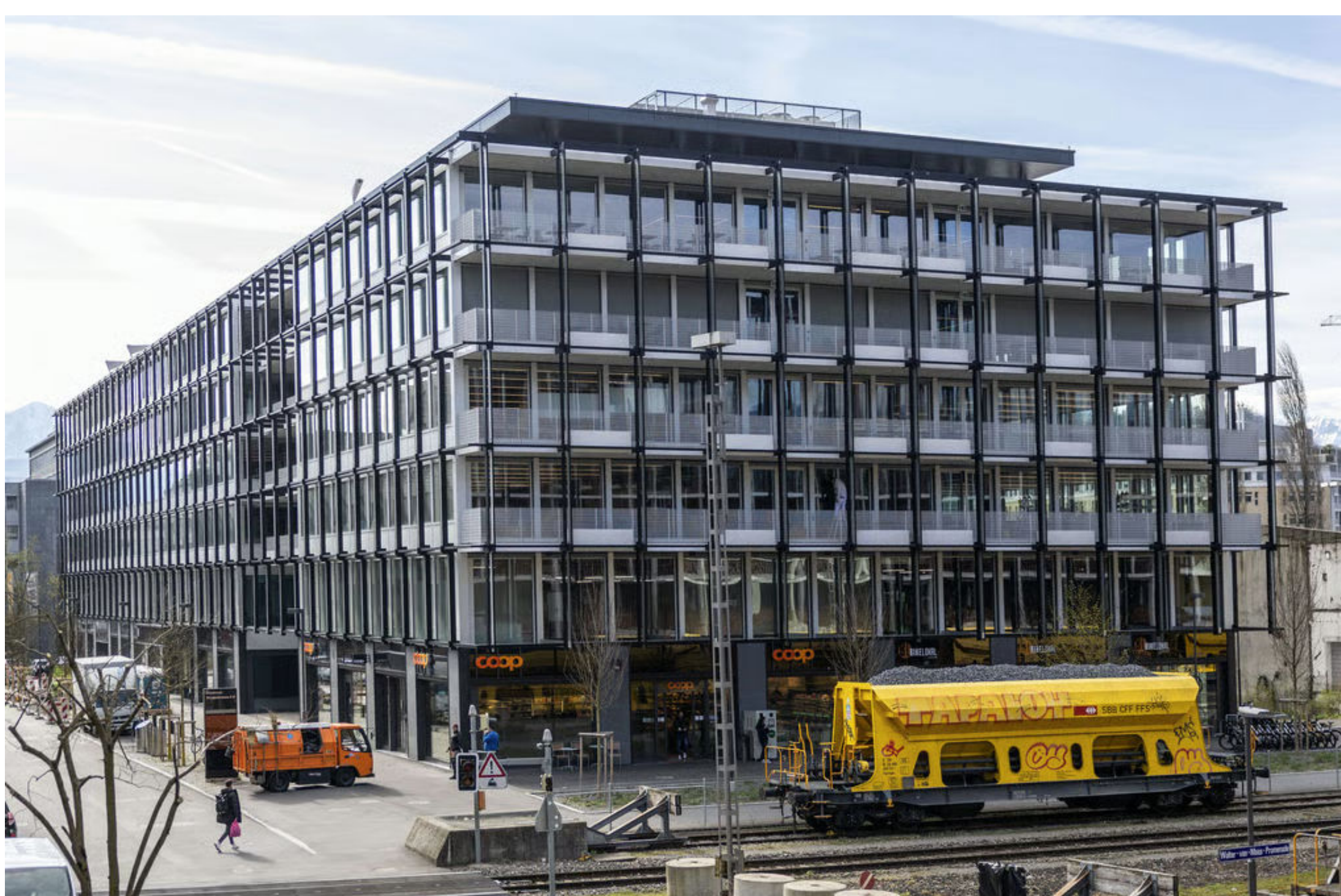
Aussenansicht des neuen MSD-Hauptsitzes im Luzerner Rösslimatt-Quartier. Hier arbeiten rund 750 Angestellte - Platz hat's sogar für 850.

Der Neubau in der Rösslimatt präsentiert sich mit seinen Glasfassaden, die oft von Sonnenstoren bedeckt sind, eher unspektakulär. Das ändert sich beim Betreten der Lobby, die einem Hotel ebenso gut anstehen würde: Verschiedene Lounges, üppig bepflanzte Grüninseln, beige-grauer Terrazzoboden und Wände in der MSD-Hausfarbe Teal (Petrol) stimmen ein auf alles, was da noch kommt.