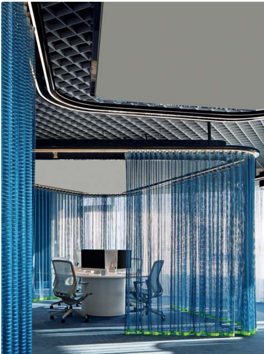
▲ In den oberen Bereichen demonstriert das Show Office ein zukunftsgerichtetes Verständnis der verschiedenen Modi der Arbeit: Konzentration, Kommunikation, Zusammenarbeit und Kontemplation. Die Grundrisse sind so organisiert, dass sie Kreativität und Teamarbeit anregen.

Die beiden Untergeschosse widmen sich ganz dem Wohlbefinden. Die Mitarbeitenden finden hier umfangreiche Sporteinrichtungen wie Basketballplätze, Kletterwände und ein Fitnessstudio, eine großzügige Geste für Entspannung, Stressbewältigung und gesundes Leben. Die Zwischenebene ist eine Reminiszenz an Traditionen der Gastfreundschaft in der Lingnan-Kultur. Ein luxuriös ausgestatteter Bankettraum bietet den perfekten Rahmen für intime Zusammenkünfte – Sternenhimmel-Ambiente inklusive.