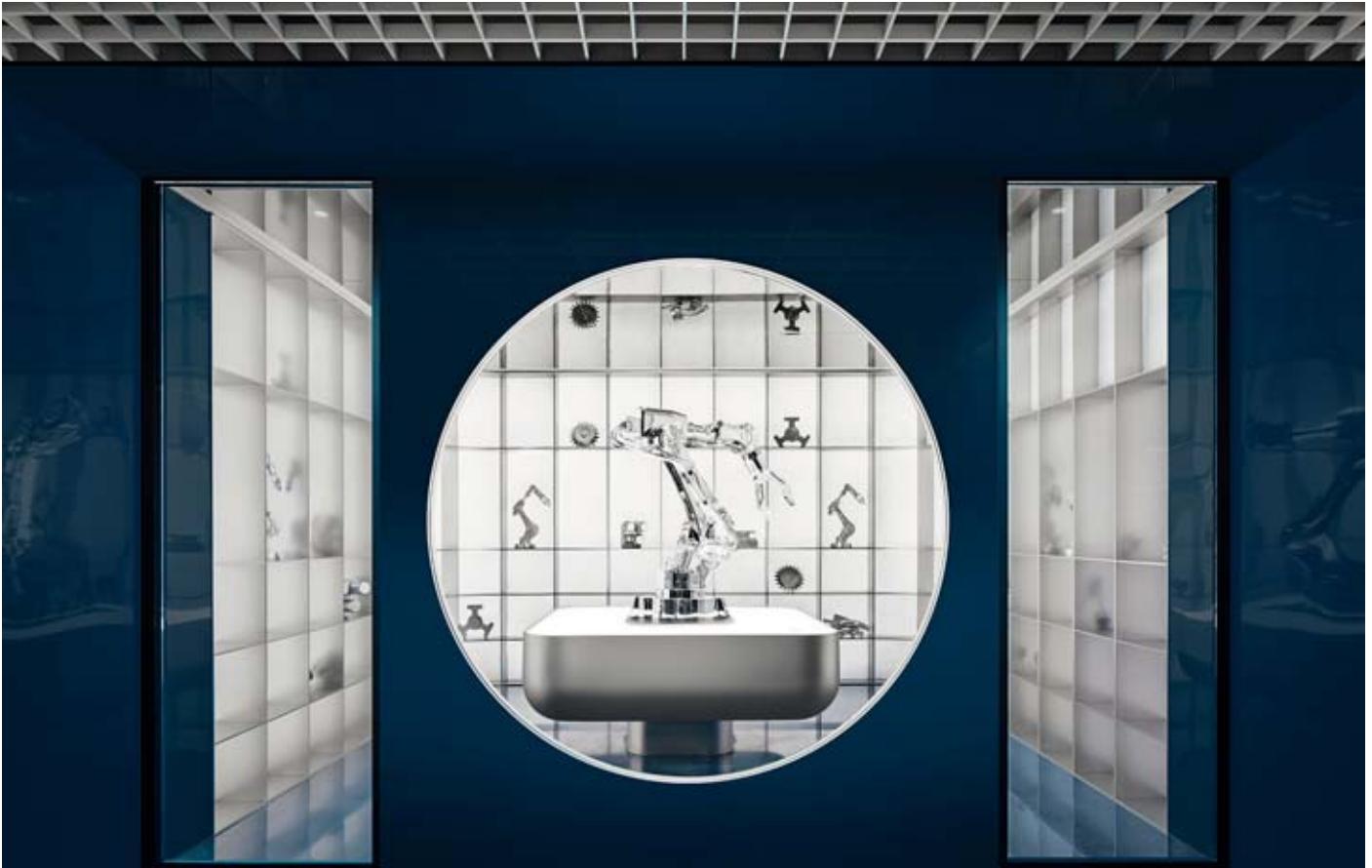
▲ Aufwendige Produktinszenierungen präsentieren symbolhaft die Ergebnisse aus Robotik und Hightech-Industrie. Hochwertige Büromöbel stehen für die Wertschätzung gegenüber den Mitarbeitenden.